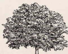
le plus ancien noyer de l'exploitation date de 1956 !