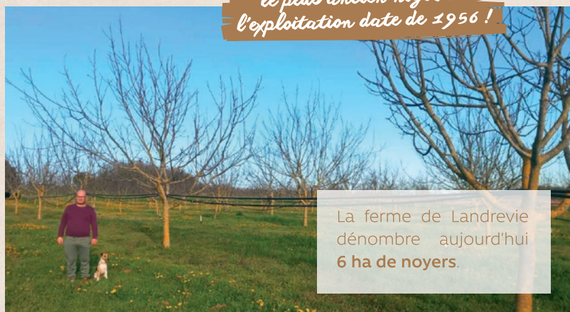
La ferme de Landrevie dénombre aujourd'hui 6 ha de noyers.