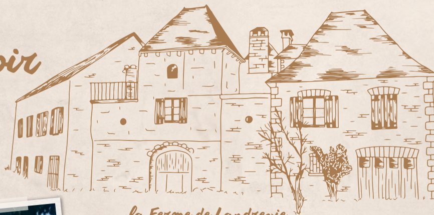
la Ferme de Landrevie